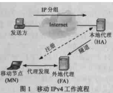
图 1 移动 IPv4 工作流程

移动 IPv4 的工作过程如下:当 MN 移动到一个网络时,它监听移动代理发出的广播信号。如果网络前缀改变了,MN 就意识到自己移动到了一个新的网络中,并尝试获取一个新的临时地址。该临时地址可以通过自动配置机制(如 DHCP)获取,也可以是 FA 的地址。前者称为配置转交地址(CCOA, Co-located Care-Of-Address),后者称为外地代理转交地址(FACOA, Foreign Agent Care-Of-Address)。如果 MN 得到的是 CCOA, MN 就用该地址作为源地址,通过与 HA 进行注册请求和注册响应的交换,完成与 HA 的注册过程。如果得到的是 FACOA, MN 就不能使用本地地址进行注册,而是通过 FA 将注册请求中继给 HA,一旦注册完成,HA 就截获送给 MN 的分组,使用 IP-in-IP 封装将这些分组通过隧道送给该 FACOA。对应的 FA 对这些分组解封